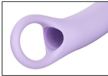
Pętla na palec dla łatwego wyjmowania