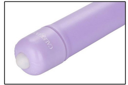
Łatwy w wyjmowaniu i wkładaniu bezprzewodowy stymulator

Delikatność wprowadzania można zwiększyć przez zastosowanie razem ze środkiem nawilżającym na bazie wody. Ćwiczenie powinno się powtarzać przez kilka minut każdego dnia. Wzmocnienie mięśni można zauważyć już po kilku tygodniach stosowania.