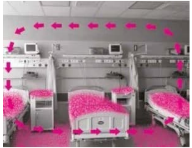
Proces oczyszczania powietrza promiennikami wewnętrznymi (powietrze) Skażone powietrze w sali bez lamp bakteriobójczych

Proces oczyszczania powietrza poprzez energooszczędne lampy przepływowe serii NBVE polega na wymuszonym obiegu powietrza przez komorę dezynfekcyjną, w której znajdują się promienniki bakteriobójcze.